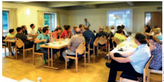
Bürgermeister Franz Schönmoser stellt den derzeitigen Sachstand des Marktplatzes vor.

matik betroffen. Um nun systematisch an das Thema Leerstand heranzugehen, ist eine Bestandsaufnahme und Bedarfsanalyse erforderlich. Der Marktgemeinderat wird deshalb in einer seiner nächsten Sitzungen ein professionelles Einzelhandelsgutachten für den Markt beauftragen, welches auch eine umfassende Bürgerbefragung beinhalten wird. Wir möchten Sie deshalb