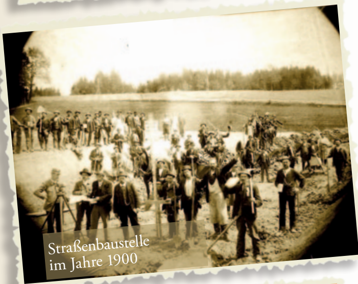
Straßenbaustelle im Jahre 1900