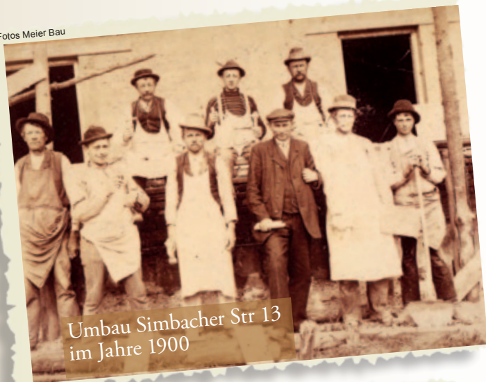
Umbau Simbacher Str 13 im Jahre 1900