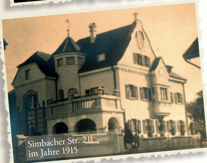
Simbacher Str. 21 im Jahre 1915