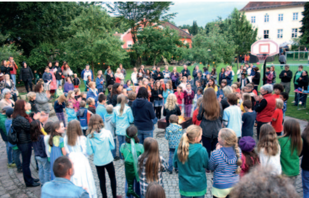
Das Sommerfest fand beim gemeinsamen Singen und Tanzen einen gelungenen Abschluß.